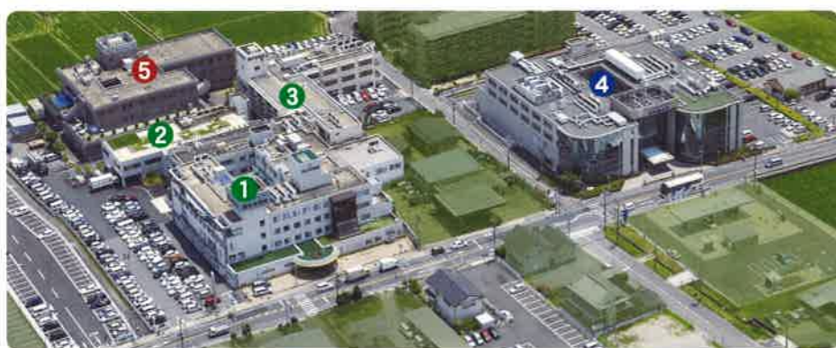
「メビウス大和郡山」から車で約5分の位置にあります。

本格的な高齢化社会を迎え、これからは病気を治療するだけでなく、療養・介護まで含めてきちんとケアする体制づくりが求められます。私たちは一人ひとり一生涯を見守ることのできる医療環境づくりのため総合医療施設としての医療分野はもちろん、療養病棟、リハビリ施設、介護老人保健施設まで手がけ、様々な経験とノウハウを蓄積してきました。介護付有料老人ホーム「メビウス大和郡山」は、その一つの到達点といえます。私たちは地域の皆様に役立つ施設であるよう独自性の確立をめざすとともに、一人ひとりの入居者さまを生涯にわたって温かくサポートできる施設でありたいと願っております。