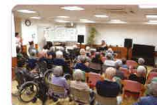
地域交流・機能訓練室