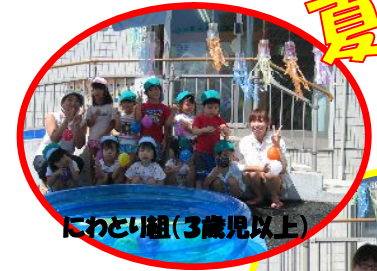
にわとり組(3歳児以上)