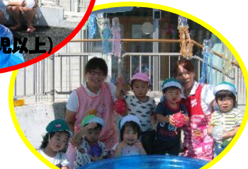
ひよこ組(3歳児未満)