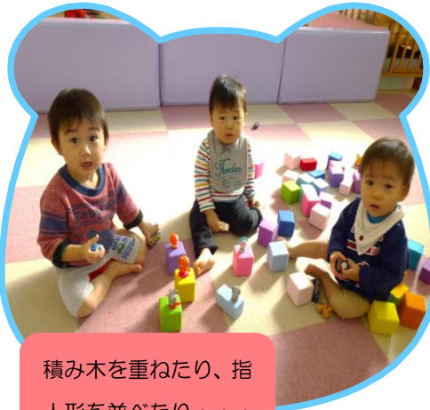
積み木を重ねたり、指人形を並べたり・・・