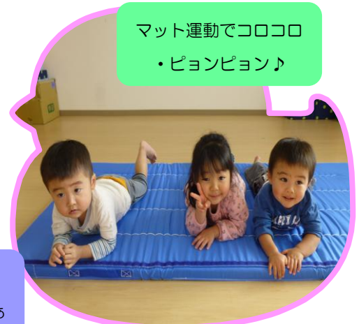
マット運動でコロコロ ・ピョンピョン♪