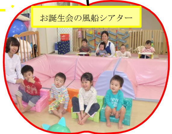
お誕生会の風船シアター

感染症が流行る季節です。ウイルスに負けないよう体力をつけ、食事、睡眠など生活リズムを整え、手洗い・うがいをしましょう。