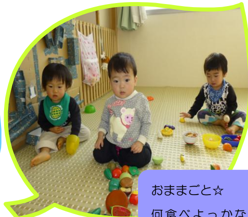
おままごと☆ 何食べよっかなあ