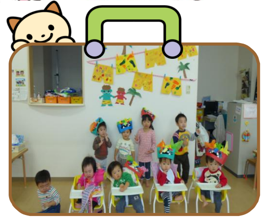
新しいお友達が増えました