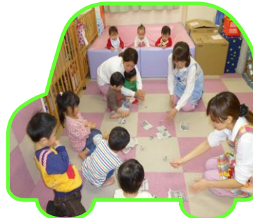
鬼が来るぞー！ 新聞くしゃくしゃ 豆の用意☆