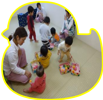
お兄ちゃんお姉ちゃんは レゴブロックで動物園☆