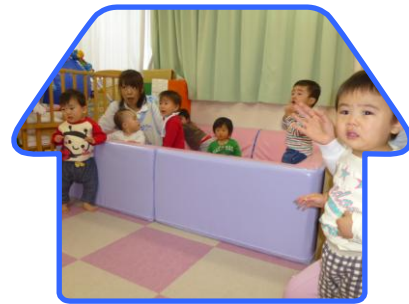
鬼が来たー！！ 怖いよ 逃げろー