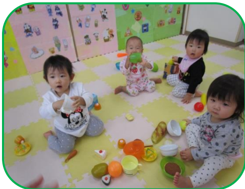
ままごと遊び中! あ〜ん! おいしいなあ〜♪