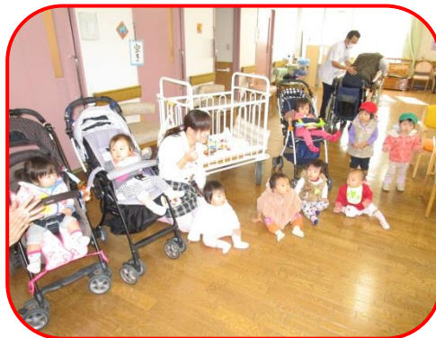
老健で歌を披露!? ステージで歌っているかのように!