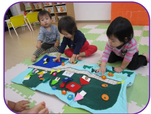
布の玩具でマジックテープをぺたぺた…♪