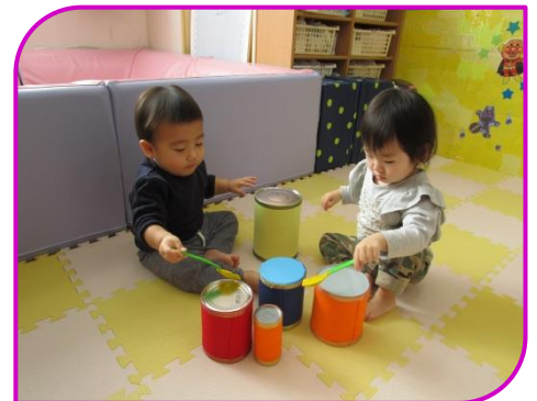
楽器遊び♪手作りの太鼓をトントントン♪