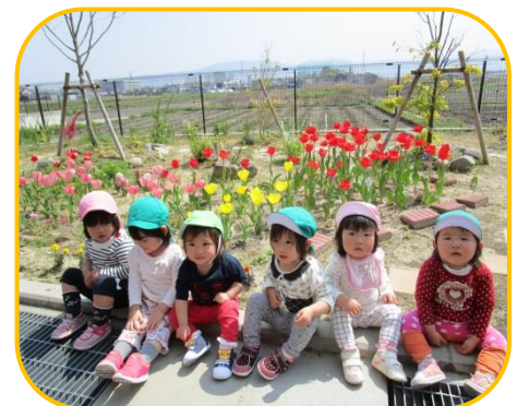
老健の畑でチューリップがきれいに咲いていましたよ♡