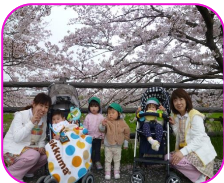
秋篠川沿いの桜並木で記念撮影しました！満開の桜が素敵で地域の方にも声をかけて頂き、子ども達も喜んでいましたよ♡