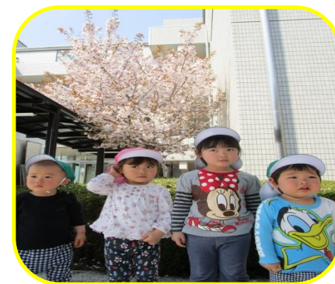
メディカルプラザの前のきれいな桜の木の下でパチリッ♡