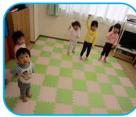
アンパンマンの「サンサン体操」で元気に いち、にい、さ〜ん♪

フェルトの手作りおもちゃ紹介 アンパンマンキャラクターのお子様ランチ・ハンバーガー・ポテト・ジュースなど