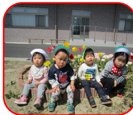
気持ちいい春の季節に老健のチューリップ畑でハイ・ポーズ!

今月は、連休が続き生活リズムなど崩しやすい時期なので一人ひとりの子どものリズムや体調を整えながら元気に過ごしていきたいと思います。