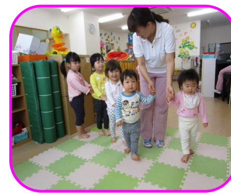
「ゾウさんとくもの巣」の歌に合わせてみんなで繋がって遊びました☆