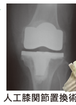
人工膝関節置換術