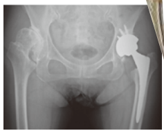
人工股関節置換術