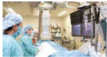
透視下で行うカテーテル検査・治療

同院では2006年に心臓血管カテーテル室を開設、狭心症や心筋梗塞の疑いがある人の冠状動脈や心臓の状態を細かく調べるカテーテル検査・治療を行っている。虚血性心疾患（狭心症・心筋梗塞）が重症化する前に、マルチスライスカテーテルという検査でスクリーニング。冠状動脈の狭窄を初期段階で診断し、早期にカテーテル治療すれば治療率も高くなる。